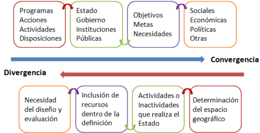
Figura 1: Elementos de Convergencia y Divergencia en las definiciones de Políticas Públicas

21 y 22 de abril de 2016, Cortazar, Guanajuato, México