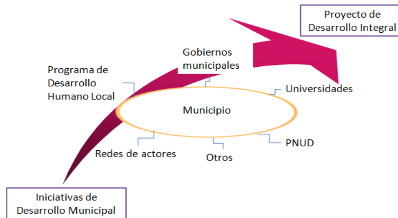
Figura 3: Instrumentos y actores que han promovido el desarrollo local en los municipios cubanos

Un rasgo distintivo en los PDI ha sido la dirección de los gobiernos municipales con la participación de las universidades como interfase de los mismos, instituciones estatales, organismos internacionales y redes de actores múltiples. En la figura 6 se sintetiza la evolución de las IDM hacia el PDI a partir de los instrumentos y agentes que han intervenido en su proceso de desarrollo: