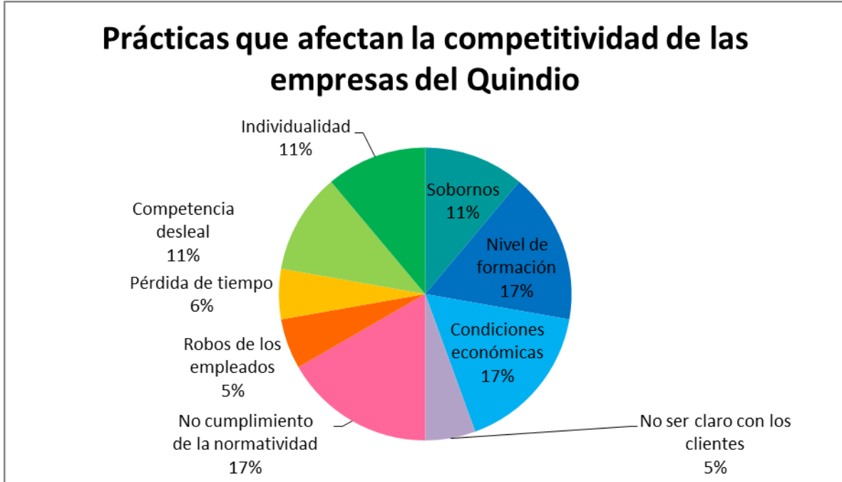
Ilustración 1: prácticas laborales que atentan con la competitividad en las empresas del Quindío.

La ilustración 1, muestra los factores que se presentan en las empresas del Quindío y que atentan contra la competitividad de ellas.