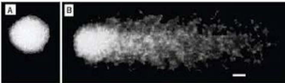
Figura 1. Apariencia de las células de metanuplios de Artemia franciscana en el ensayo cometa. A) Célula sin daño. B) Célula con daño. Escala: 10 µm.