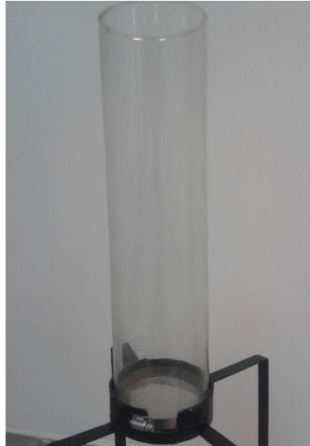
Figura 2. Construcción del Secador de lecho fluidizado.

En la Figura 2 se observar la columna de vidrio y la base con la que se cuenta para el montaje del motor. Debido a que el control de velocidad de flujo de aire y la temperatura del secador dentro de la columna son aspectos importantes. Se decidió elaborar una interfaz gráfica de usuario diseñada en MATLAB, con la finalidad de realizar el sensado de temperatura en tiempo real.