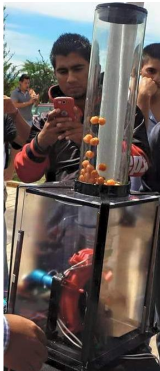
Figura 3. Funcionamiento del secador de lecho fluidizado.

Las Figuras 3 y 4 muestran el funcionamiento del secador de lecho fluidizado y la gráfica de temperatura que fue obtenida a través de la interfaz gráfica de usuario.